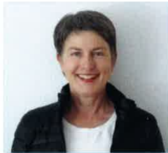
Leitung: Michaela Schwaab