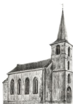
St. Stephanus, Effelsberg

In der Zeit vom 2.1.2023 bis 16.1.2023 liegen die Jahresbilanzen 2018, 2019, 2020 und 2021 der Kirchengemeinde während der Öffnungszeiten des Zentralbüros in Bad Münstereifel zur Einsicht aus.