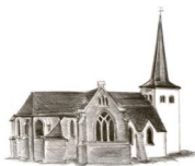
St. Goar, Schönaun

Am Freitag, dem 5.1.2023, findet im Anschluss an die Abendmesse die Eucharistische Anbetung statt.