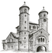
St.Chrysanthus und Daria, Bad Münsterneifel