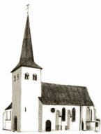
St. Helena, Mutscheid