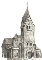
St. Thomas, Houverath

In der Zeit vom 2.1.2023 bis 16.1.2023 liegen die Jahresbilanzen 2017, 2018, 2019, 2020 und 2021 der Kirchengemeinde während der Öffnungszeiten des Zentralbüros in Bad Münstereifel zur Einsicht aus.