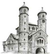
St.Chrysanthus und Daria, Bad Münstereifel